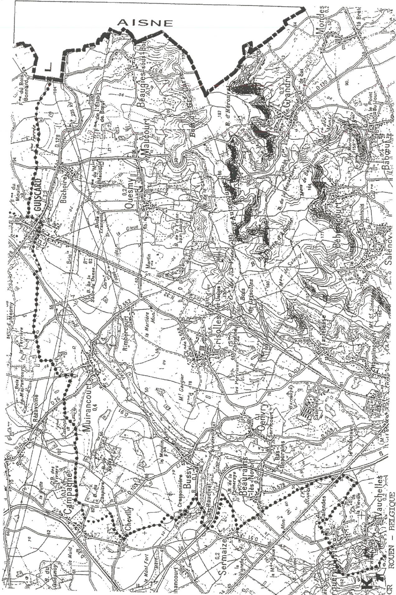
Extrait du Plan départemental de tourisme pédestre adopté par le Conseil général de l'Oise le 18 janvier 1991